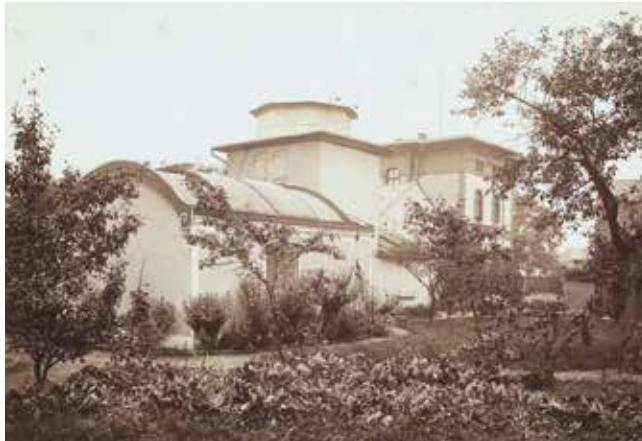
Abbildung 1: Die Bilker Sternwarte