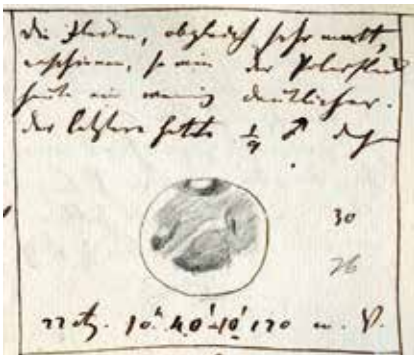
Abbildung 3: Skizze des Planeten Mars am 22. August 1845.

stimmte die Helligkeiten veränderlicher Sterne, die Positionen von Sonnenflecken und erfasste den Merkurdurchgang am 8. Mai 1845. Allerdings verließ Schmidt vermutlich auf Grund eines Zerwürfnisses mit Benzenberg die Bilker Sternwarte schon im Oktober 1845. Benzenberg selber starb im Mai 1846. Er vermachte der Düsseldorfer Stadt nicht nur die Sternwarte mit ihrer Innenein-